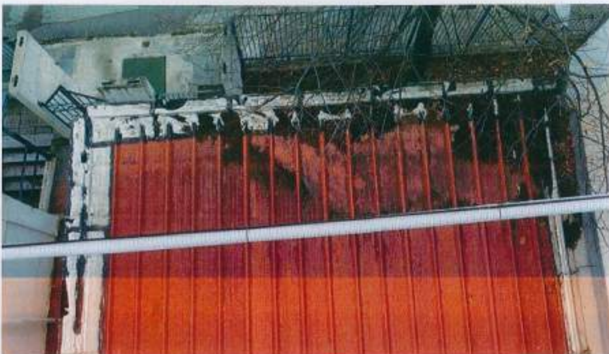
Οροφή πάνελ εισόδου