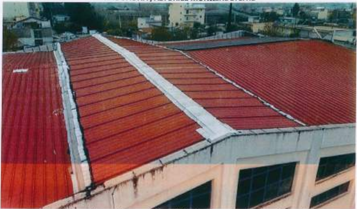
Ανοιχτοί αρμοί, σκισμένες μεμβράνες, έλλειψη περιμετρικού ειδικού τεμαχίου