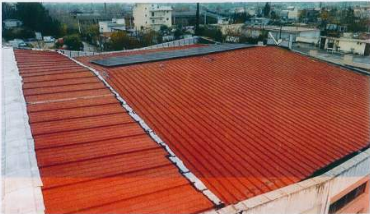
Σχίσσιμο ασφαλτικών μεμβρανών στους αρμούς μεταξύ των τμημάτων της στέγης