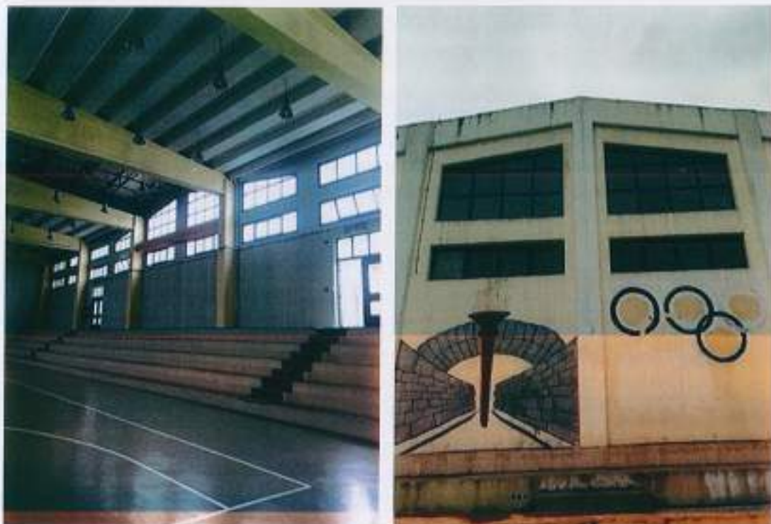
Εσωτερική και εξωτερική άποψη Κλειστού Γυμναστηρίου Δ.Ε. Ελ. Κορδελιού