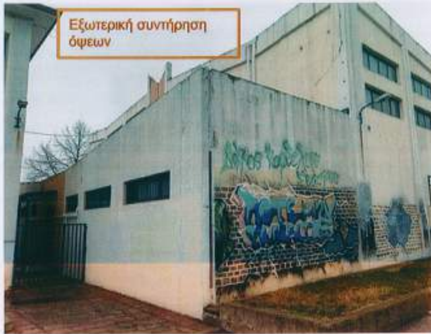
Εξωτερική συντήρηση όψεων