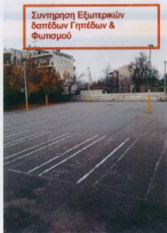
Συντήρηση Εξωτερικών δαπέδων Γηπέδων & Φωτισμού