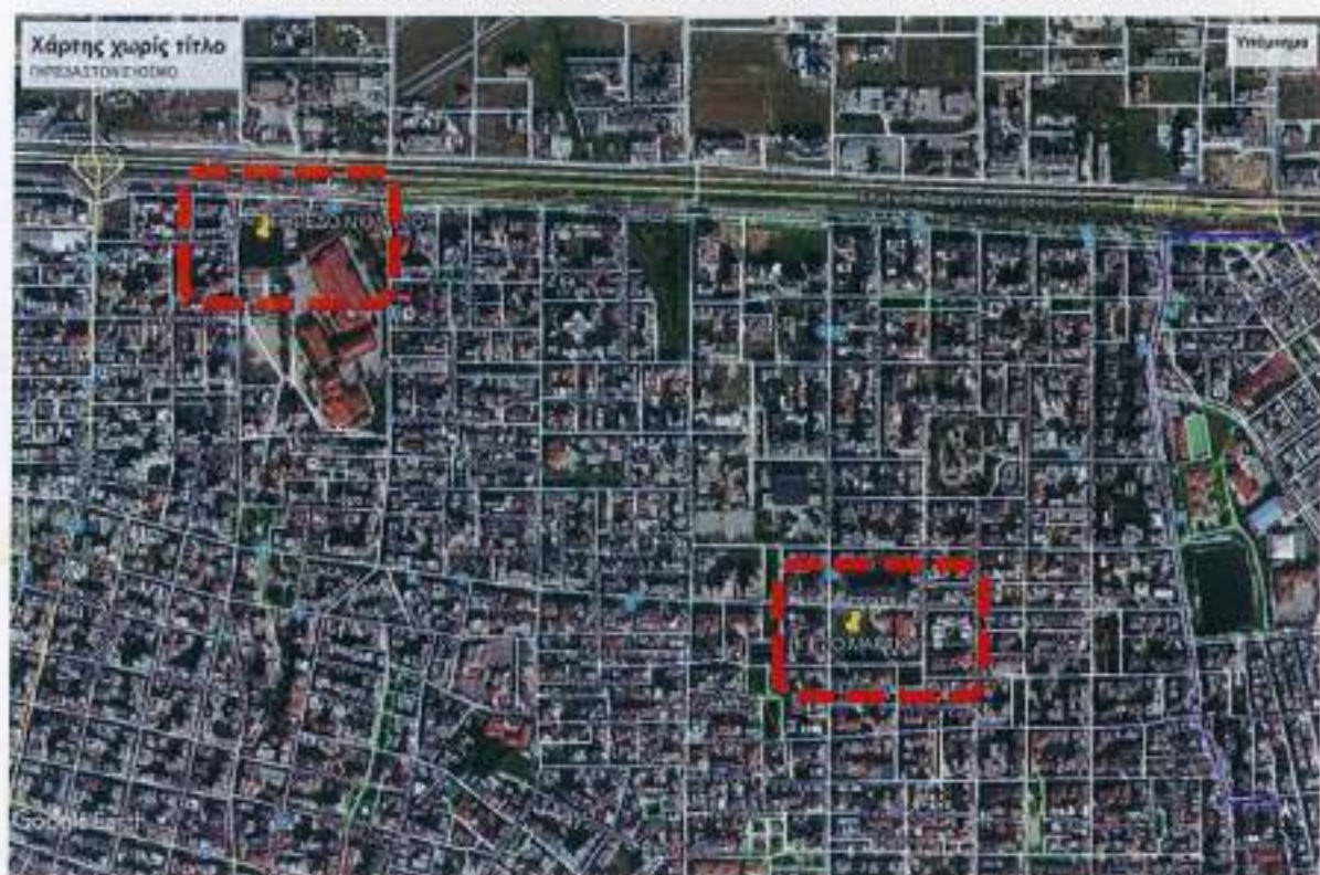
Αεροφωτογραφία ανοιχτών αθλητικών χώρων, Δ.Ε. Ευόσμου