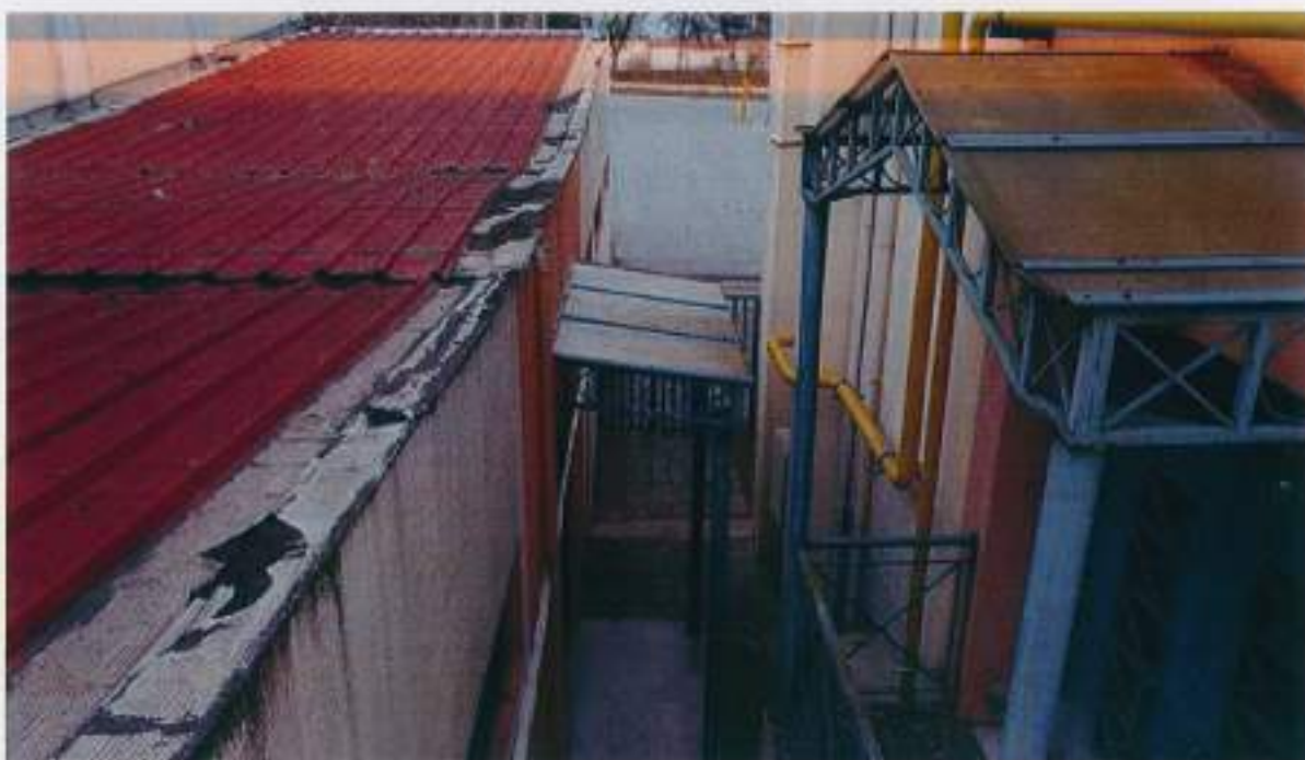
Οροφή πάνελ εισόδου-Αποσαθρωμένες ασφαλτικές μεμβράνες εκατέρωθεν της στέγης, ανοιχτοί αρμοί